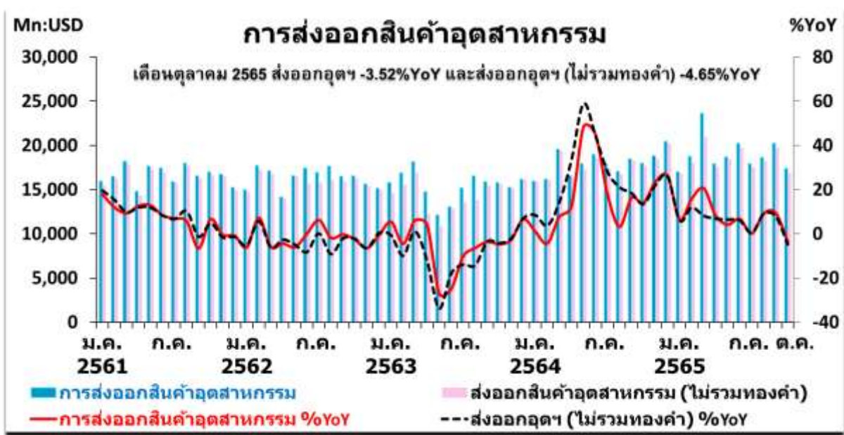
ที่มา: สำนักงานนโยบายและยุทธศาสตร์การค้า กระทรวงพาณิชย์ | ปรับปรุงข้อมูลล่าสุดเมื่อวันที่ 12 ธค. 2565

การส่งออกสินค้าอุตสาหกรรม 2 ในเดือนตุลาคม 2565 มีมูลค่า 17,393.27 ล้านดอลลาร์สหรัฐ หดตัวร้อยละ -3.52 (YoY) หรือ การส่งออกสินค้าอุตสาหกรรม (ไม่รวมทองคำ) มีมูลค่า 16,874.77 ล้านดอลลาร์สหรัฐ หดตัวร้อยละ -4.65 (YoY)