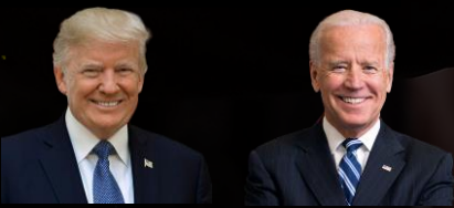
โดนัลด์ ทรัมป์ โจ ไบเดน