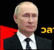
วลาดีเมียร์ ปูติน

เลือกตั้งประธานาธิบดี 15 - 17 มี.ค. 2024